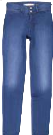
Jeans a vita alta, Wrangler € 90