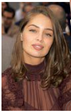
Rossetto L'Absolu Rouge Crème, Lancôme € 34,50