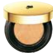
Fondotinta Teint idole Ultra Cushion, Lancôme € 48,50