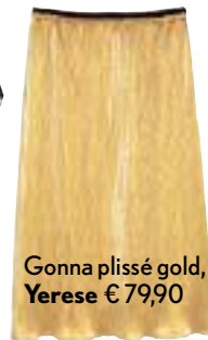
Gonna plissé gold, Yerese € 79,90