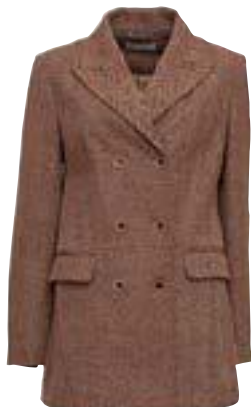
Giacca doppiopetto in lana tweed, Weili Zheng € 239,70