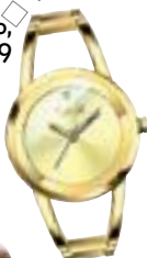
Orologio in acciaio dorato, Stroili € 79

Jeans used, mocassini in pelle laminata, micropull cropped, giacca maschile: Marie-Ange Casta (la sorella minore di Laetitia), in Gucci, sa quali sono i must dell'inverno e li indossa in un mix perfetto.