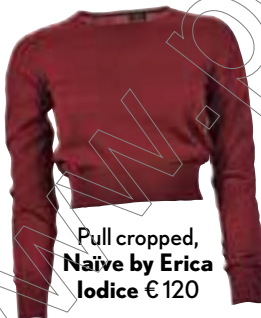
Pull cropped, Naïve by Erica Iodice € 120