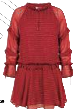
Abitino in voile, Intropia € 295