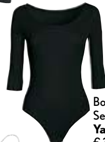
Body in tessuto Sensitive® Sand, Yamay € 39,99