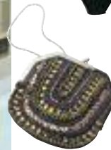
Minibag con applicazioni, Bijou Brigitte € 24,95