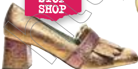
Mocassini in pelle laminata, Paola d'Arcano € 300