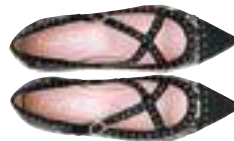
In pelle stampa pitone con borchie, Pretty Ballerinas € 289